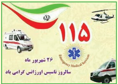
متعال، سعادت و سلامت را برای این عزیزان آرزومندم.

در تمامی ایام و به ویژه در ایام تردد زائران اربعین حسینی در سطح استان، شاهد خدمت رسانی شایسته و رضایت‌بخش به زائران ابابندالله الحسین(ع) توسط همکاران عزیز و